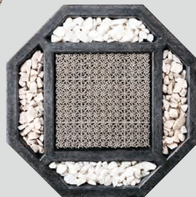
「水はね防止マット」の施工例