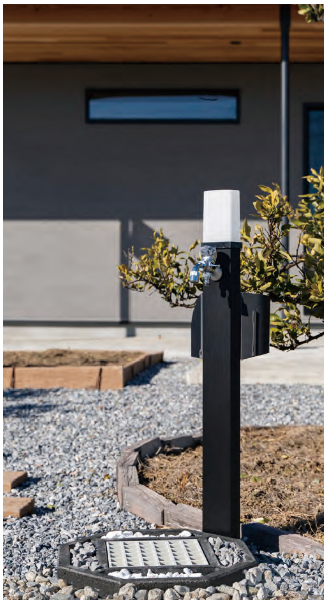
「ミスロックニロ万能水栓 2.0」と「PRIZM II(ブラック)」と「水栓パン Octagon(ブラック)」の施工例