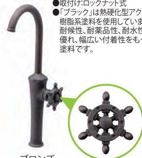
ブロンズ (ラダーハンドル)